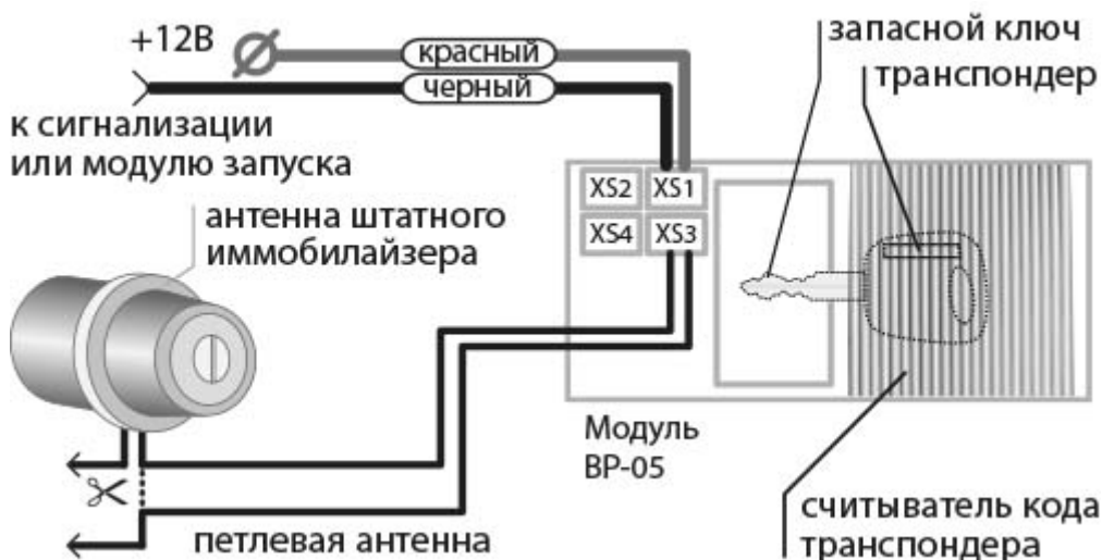
Схема рекомендуется при слабом сигнале штатного транспондерного ключа. Подключите петлевую антенну к разъему XS3 на плате, разрежьте петлю на конце и подключите провода в разрыв цепи антенны штатного иммобилайзера. Рамочная антенна модуля в этой схеме не используется.