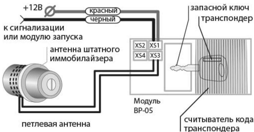
Схема подключения 4

Схема рекомендуется в случаях, когда монтаж рамочной антенны затруднён по причине конструктивных особенностей автомобиля. Намотайте петлевую антенну поверх штатной антенны RFID на цилиндре замка зажигания. Важно, чтобы расстояние между штатной антенной RFID и антенной модуля BP-05 было минимальным.